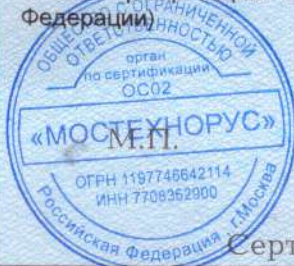
Схема сертификации: 1с (ГОСТ Р 53603-2020 Оценка соответствия. Схемы сертификации продукции в Российской Федерации)